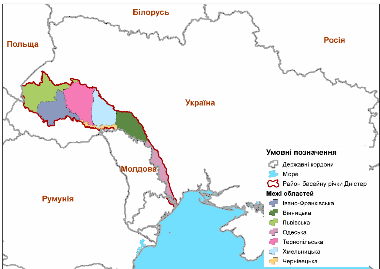
Рисунок 2.1 – Розташування району басейну річки Дністер

Район басейну р. Дністер є цілісним, складається з басейну р. Дністер у межах України, перехідних вод та прибережних вод (акваторія Чорного моря між береговою лінією та лінією у територіальному морі на відстані однієї морської милі від вихідної лінії, що використовується для визначення ширини територіального моря). Межа району басейну р. Дністер проходить по лінії державного кордону з Республікою Польща, Республікою Молдова та через населені пункти по лінії вододілу [4]. Район басейну річки Дністер розташований у семи областях на південному заході України (Львівська, Івано-Франківська, Тернопільська, Хмельницька, Вінницька, Чернівецька, Одеська області) (рис. 2.1).